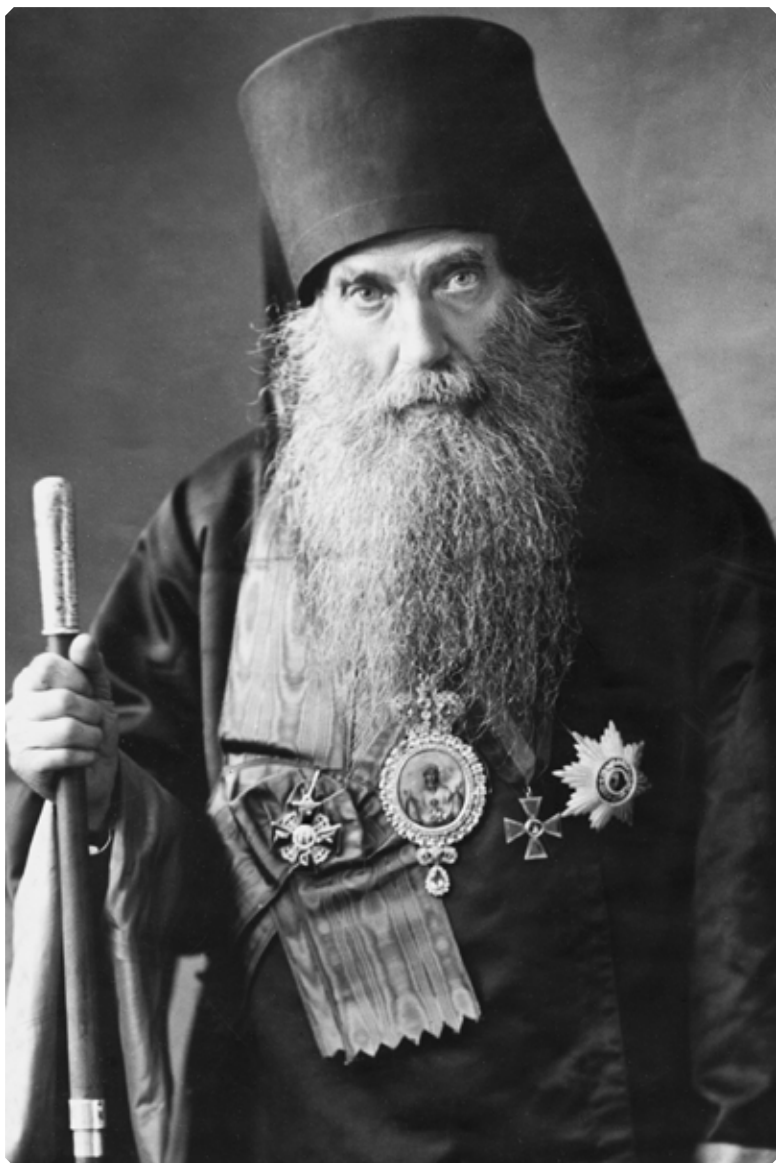
Преосвященнейший Иннокентий (Соколов), епископ Бийский. Начало XX в. БКМ

«Журнальным определением Консистории, от 17 мая 1911 года за № 452, утвержденным Его