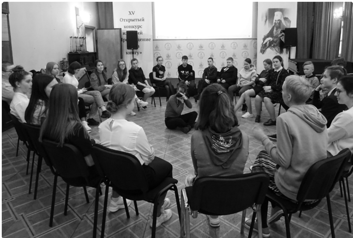
Последние наставления перед очным этапом конкурса. 8 мая 2021 г.

– Два года назад Вы открыли мне, что много читаете. Вы были увлечены чтением Виктора Гюго, Оноре де Бальзака, Александра Дюма. Планировали знакомиться с творчеством Ремарка и начать чтение романа «Три товарища». Планы осуществились?