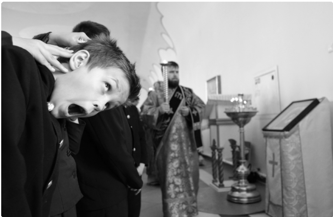
«Нагибай вью его в юности...» Бийская православная школа. 23 января 2013 г.

Внезапно я вспомнила. Вспомнила о вчерашней моей вечерней молитве. И, прогоняя застывающее в крови отчаяние, взмолилась по-новому: «Помоги, Богородице! Дай маме денег. Дай ей. Чтоб она поверила!» Уже темнело, день ознобным маревом прошел мимо. Я взяла сумку и понесла ее маме с отчаявшейся уверенностью. Мама сидела на кухне потерянная, оцепеневшая. Сестра была тут же, застывшая в немом бессильном утешении. Положив маме сумку на колени, я выдохнула «посмотри» так, что она послушалась, только вздохнув. Дрожащая ладонь исчезла в тканевых недрах. Небрежное движение, вдруг застывшее. Ее пальцы, ледяные потные пальцы, сжимали лей. «Кто из вас подложил мне деньги?» – ее голос срывался. «Мама, мы бы, ...если б у нас было...», – сестра заикалась, округлив глаза в трепете.