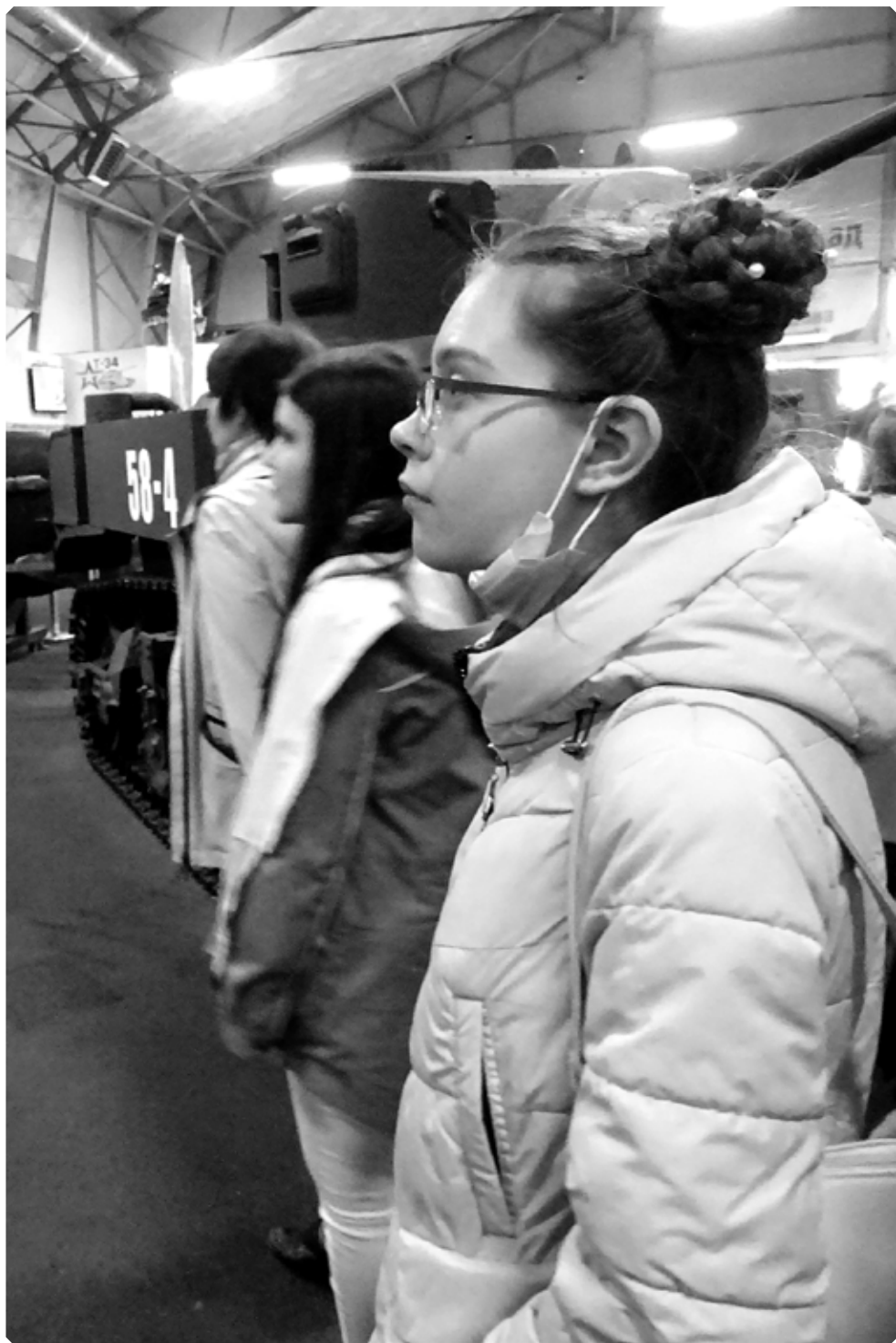
В парке «Патриот». 9 мая 2021 г.

Утром я нашла маму на кухне безутешно плачущей. На мой вопрос она тихо со сдавленной обреченностью проговорила: «У нас нет больше ничего... Только соль. Мы всё доели вчера вечером». Лихорадочно цепляясь за последнюю надежду, я напомнила маме, что иногда кто-то, видимо зная о нашем бедственном положении, подкладывает в ее сумку монетки ценностью в один-два лей. Мама безнадежно пожала плечами, она уже успела обыскать всё несколько раз самым тщательным образом. С упрямством