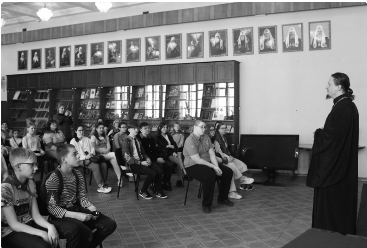
Финалистов конкурса напутствует помощник Председателя Издательского Совета Русской Православной Церкви иеромонах Макарий (Комогоров). 7 мая 2021 г.

– От всех читателей журнала и от себя лично я поздравляю Вас с участием в финале литературного конкурса.