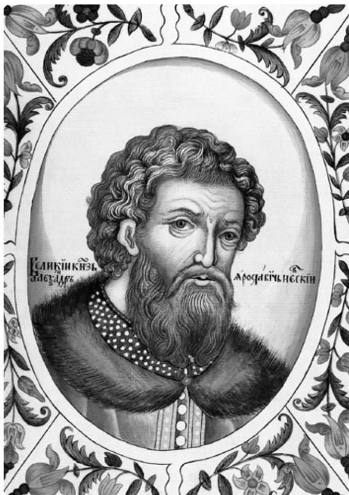
Великий князь Александр Ярославич Невский. Рисунок из «Царского Титулярника». 1672 г.

Мало разумея о Господе нашем Иисусе Христе, Сыне Божиим, я, худой и многогрешный, осмеливаюсь описать житие святого князя Александра, сына Ярослава, внука Всеволода. Поели-