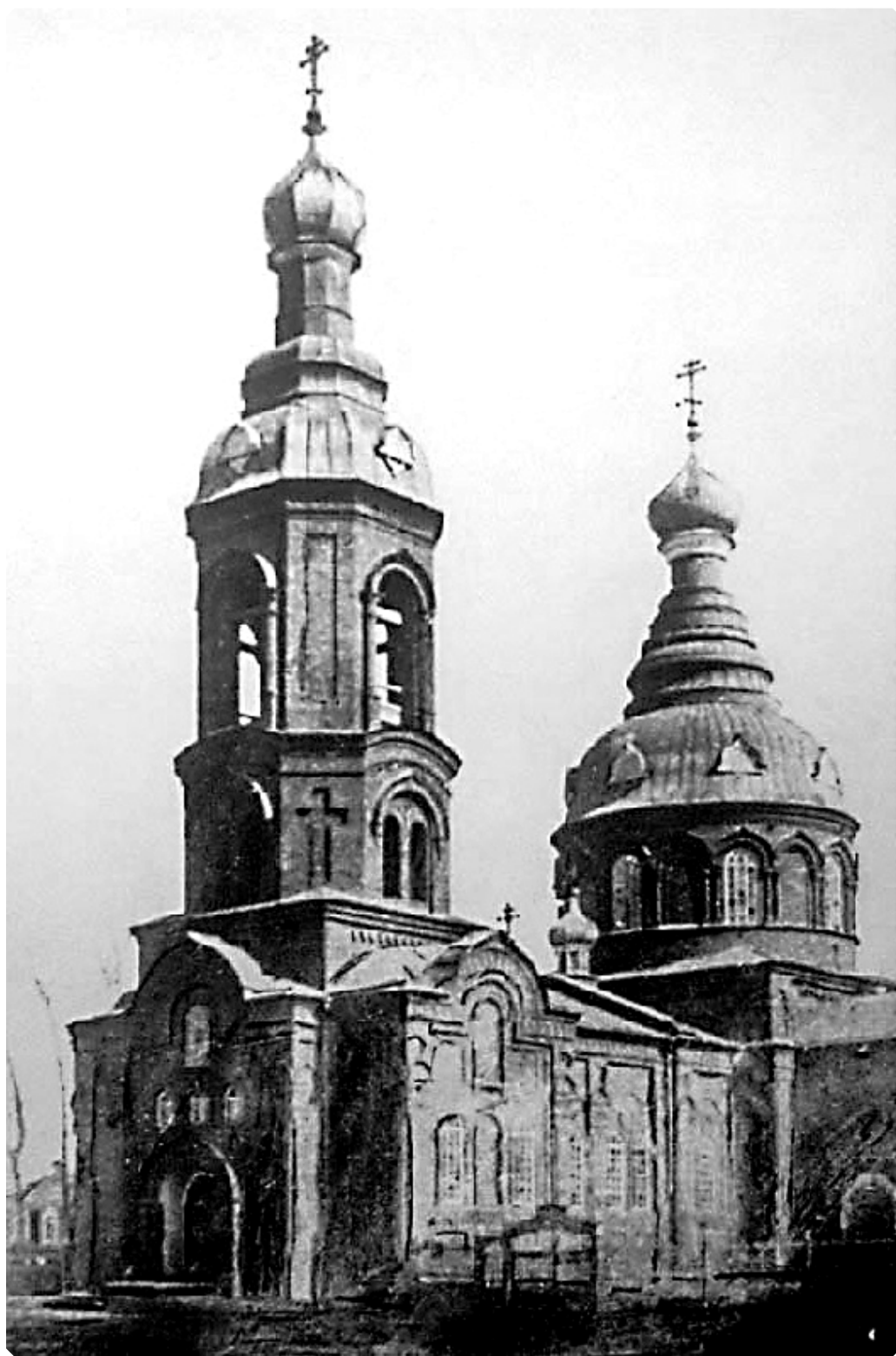
Градо-Бийская Александро-Невская церковь. Начало XX в.